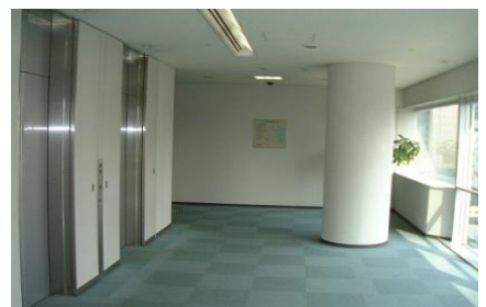
標準階エレベーターホール